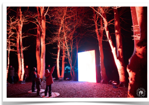
Fra Vinterlys 2023

Lys indgår også i en reovering af tunnellen under jernbanen mellem Bredgade og Amager – et projekt, der har været undervejs i flere år og som forhåbentlig snart ender i en god løsning.