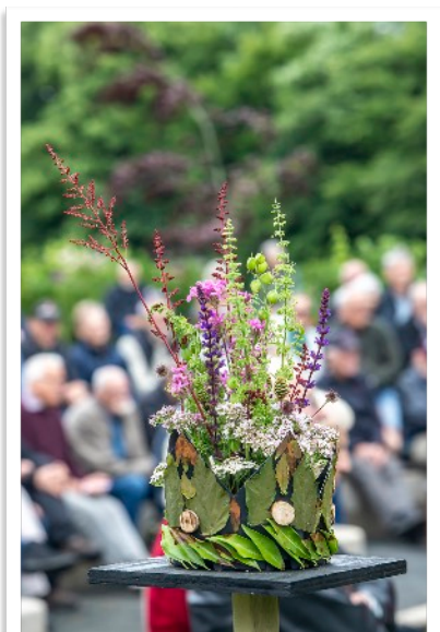
Grundlovsfest i Forsøgshaven i Tarm