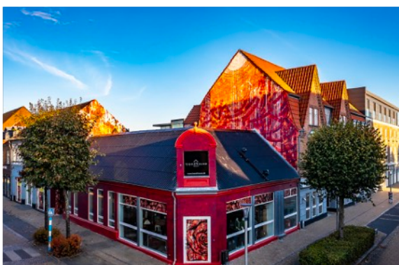
Dronefoto af de nye gavlmalerier

Ikke nok med det: Unge elever på HTX arbejdede kreativt med ideer til byens udseende og liv. Ideerne blev fremlagt i tomme butikslokaler i Jernbanegade – tak for indsatsen.